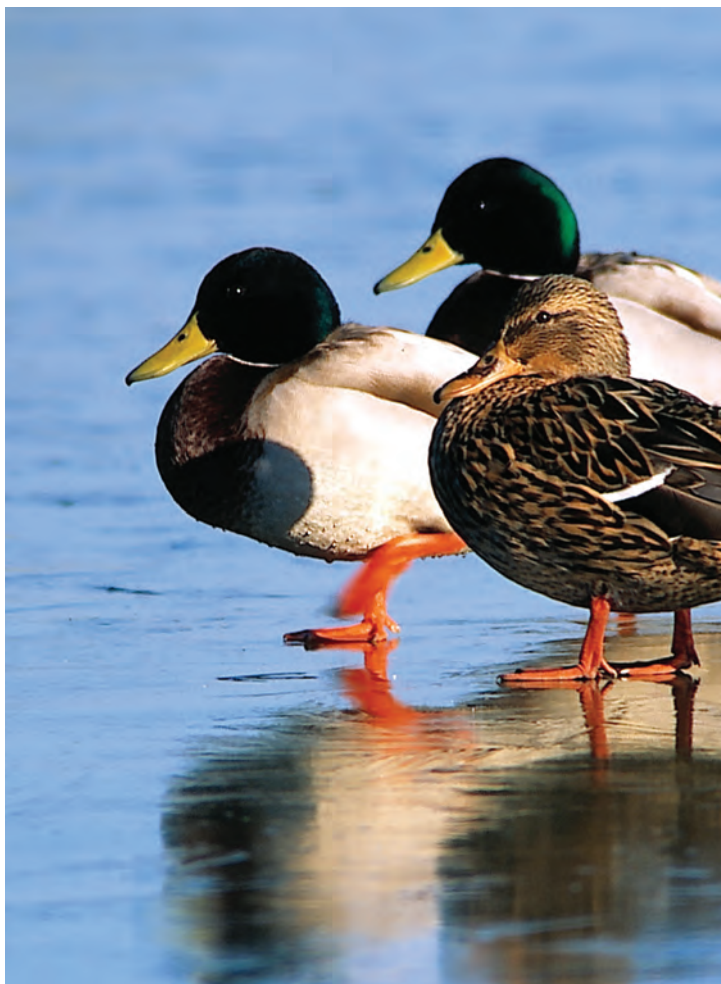
Ánades reales descansando