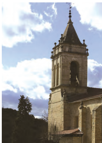
Iglesia de Salinas de Añana

9,8 km.- Llegamos a Salinas de Añana y podemos observar cómo se disponen las salinas a lo largo del valle.