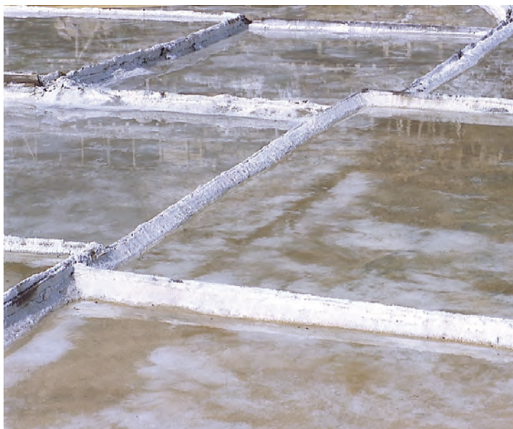
Las eras de la sal