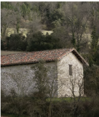
Ermita de Nuestra Señora del Lago

La vegetación crece en sus orillas de forma concéntrica, desarrollándose el malvavisco, algas y la "utricularia", una planta carnívora. En las áreas colindantes hay bosquetes de roble carrasco y quejigo. El lago es punto de parada de un gran número de aves migratorias, principalmente anátidas.