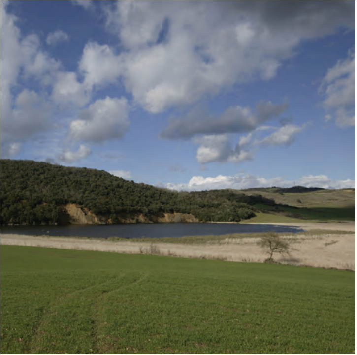
Lago de Caicedo-Yuso

4,7 km.- Llegamos al Lago de Caicedo-Yuso. Este lugar se trata de un importante punto para la escala de aves migratorias.